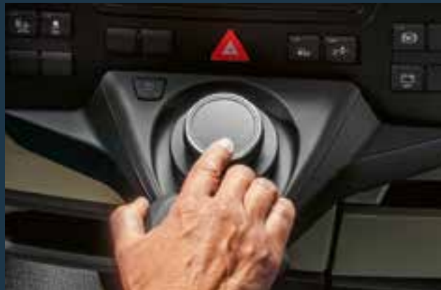
Innovatieve multimediabediening met MAN SmartSelect

Diverse slimme opbergvakken en compartimenten maken optimaal gebruik van de extra ruimte. De plafonddakken boven de voorruit, de multifunctionele compartimenten en de beveiligde, uittrekbare lades in het midden van het instrumentenbord zijn bijzonder praktisch in het dagelijkse leven van de chauffeur. Naargelang de gekozen cabine zijn er ook verschillende opbergboxen, compartimenten en een inbouw- of uittrekkoelkast verkrijgbaar. Zo beschikt de