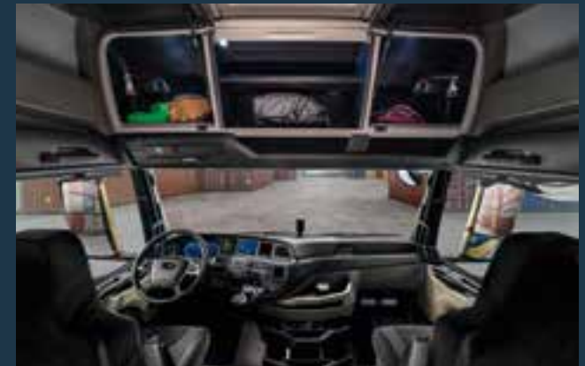
Ruime afsluitbare opbergtruimte boven het raam

GX-cabine over meer dan 1.100 liter opbergtruimte, zodat u alles kunt meenemen wat u nodig hebt, zelfs wanneer u meerdere dagen onderweg bent.