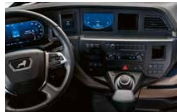
Infotainmentsysteem met 7"-scherm en MAN SmartSelect