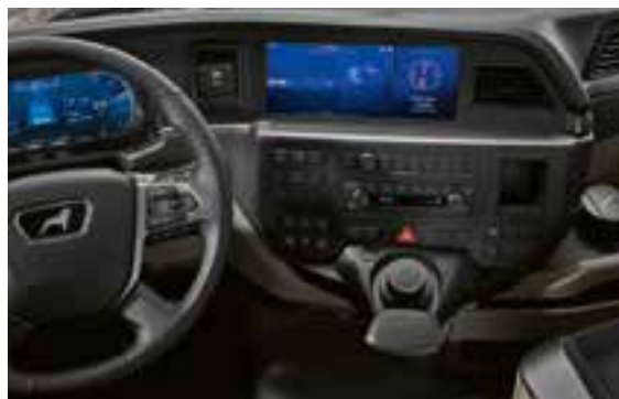
Infotainmentsysteem met 12"-scherm en MAN SmartSelect

De bediening zelf gebeurt via een bedieningspaneel met toetsen en vanaf de Premium-variant van het MAN-mediasysteem met MAN SmartSelect. Hierbij wordt een vertrouwd gebruik gecombineerd met innovatief comfort. Het resultaat is zicht- én voelbaar, want de hoogwaardige oppervlakken voelen bij elke rit met de nieuwe MAN TGX aangenaam aan.