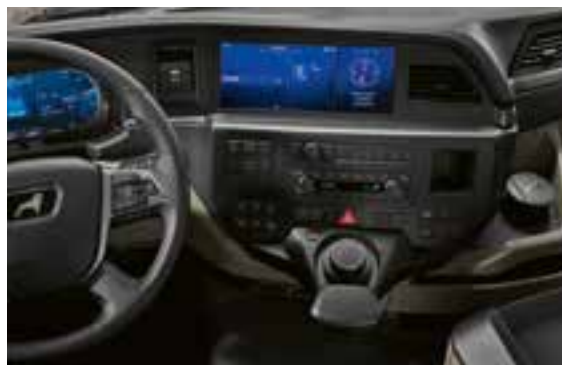
Infotainmentsysteem met 12"-scherm en MAN SmartSelect