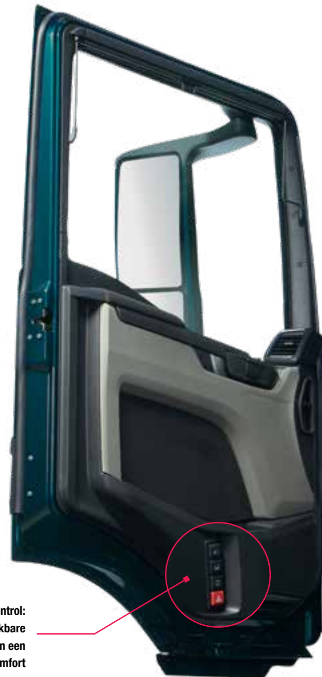
MAN EasyControl: vier van buitenaf bereikbare bedieningsknoppen bieden een maximaal comfort

Ook de positie van het stuurwiel is nu nog flexibeler: in de rustpositie komt het stuurwiel helemaal naar voren in een horizontale positie. In de bedrijfspositie is zelfs een zeer steile stuurwielhoek, zoals in een personenwagen, mogelijk. Het resultaat: een werkplek die zich in zo goed als alle richtingen aan de bestuurder aanpast. En niet omgekeerd.