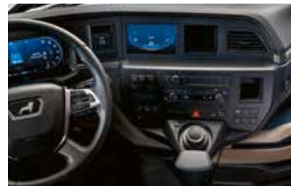
Infotainmentsysteem met 7"-scherm en MAN SmartSelect