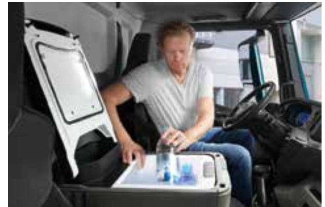
Perfect voor onafhankelijke types: koelbox/koelkast aan boord

Optimaal bedieningsgemak vanuit bed. Dat kan! Want alle belangrijke functies zijn via een speciale module te bedienen en te controleren vanuit een liggende positie. Licht, vergrendeling, standverwarming, vensters, alles maar één druk op de knop verwijderd. Hetzelfde voor radio, muziek, omgevingscamera en belangrijke informatie over de stand van