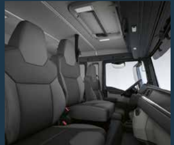
Tweede bijrijdersstoel in dubbele cabine van MAN

De dubbele cabine is niet alleen een praktische optie: de elegante voorkant is ook ontworpen in dezelfde stijl als de nieuwe MAN TG-vrachtwagens. Aerodynamisch geoptimaliseerde voorzieningen minimaliseren het brandstofverbruik en verbeteren de efficiency.