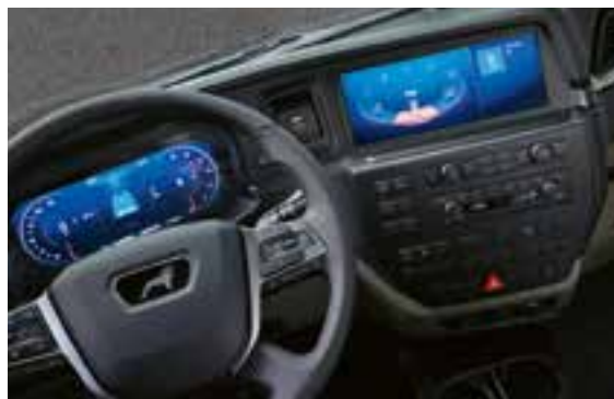
Infotainmentsysteem met 12"-scherm en keuzeschakelaar