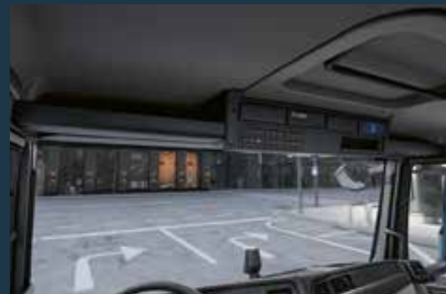
De twee ruime opbergvakken boven de voorruit zijn ideaal voor items die gemakkelijk toegankelijk moeten zijn

cabine altijd perfect afgestemd op de specifieke behoeften van de chauffeurs.