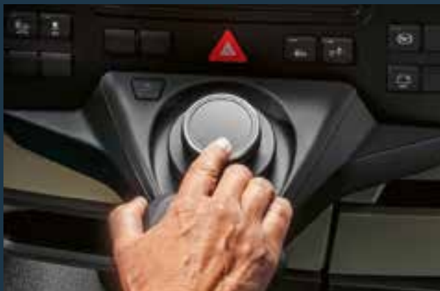
Innovatieve multimediabediening met MAN SmartSelect

Het hart van de nieuwe MAN Truck Generation is de chauffeurscabine. We hebben deze van het dak tot aan de voetruimte opnieuw ontworpen. Want comfort in de cabine betekent eenvoudigere arbeidsprocessen en een snellere afwikkeling van uw transportorders. Perfecte voorwaarden voor een nog betere motivatie bij de chauffeur en dus een investering die elke dag haar vruchten afwerpt. Het beste voorbeeld hiervan is het multifunctionele stuurwiel: een duidelijke clustering van functies in rij-assistentie (links), menubediening (rechts) en infotainmentbediening. Alle functies kunnen op eenvoudige en logische wijze worden bediend. De nieuwe cabine maakt heel wat extra ruimte vrij, die in beide vrachtwagens wordt benut om opbergvakken en compartimenten te integreren. Zo wordt het een stuk eenvoudiger om de cabine ordelijk te houden. Dat gaat van compartimenten boven de voorruit tot diverse opbergoplossingen in het centrale gedeelte of geïntegreerd in de bijrijdersstoel. Naargelang de gekozen cabine zijn deze compartimenten, de koelkast en andere lades verkrijgbaar in verschillende afmetingen. Daardoor is de